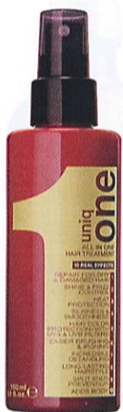
UniqONE All In One Treatment, 150 ml, 125 kr.