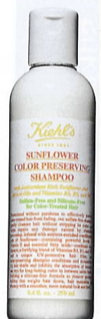
Kiehl's Sunflower Color Preserving Shampoo, 250 ml, 130 kr.