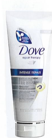
Dove Intense Repair Express Treatment Conditioner, 200 ml, 40 kr.