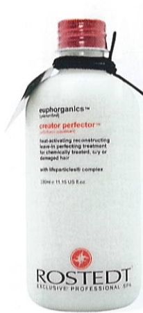
Rostedt Euphorganics Creator Perfector Leave-In Treatment, 330 ml, 439 kr.