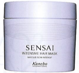
Sensai Intensive Hair Mask, 200 ml, 425 kr.