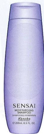
Sensai Moisturising Shampoo, 200 ml, 225 kr.