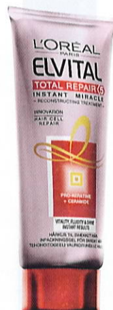
L'Oréal Elvital Total Repair 5 Instant Miracle Treatment, 200 ml, 40 kr.