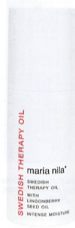
Maria Nila Swedish Therapy Oil, 159 kr.