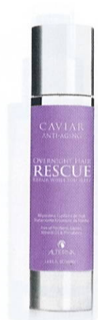
Alterna Caviar Overnight Hair Rescue, 100 ml, 359 kr.