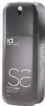
IdHair Elements Bythe/Sea Saltwater Spray , 150 ml, 169 kr.

Lad håret falde tilfældigt "rigtigt" med disse produkter: