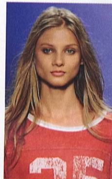
Lee Stafford Blow Dry Your Hair Faster Spray , 200 ml, 99kr.