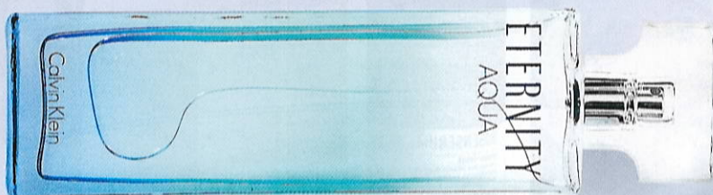
Eternity, Calvin Klein, eau de toilette, 200 ml, 525 kr.

NÆRING TIL HÅRET Sol, varme og poolvand kan gøre dit hår til en knastør omgang candyfloss. Ligesom huden kræver dit hår fugt for at bevare smidigheden og en sund glans. Uden fugt bliver håret porøst og knækker nemmere. Heldigvis findes der masser af gode hårprodukter, som kan tilføre fugt uden at tynde håret. Invester i kvalitetsprodukter, som kan beskytte lokkerne og sluse fugten dybt ned i hårstråene.